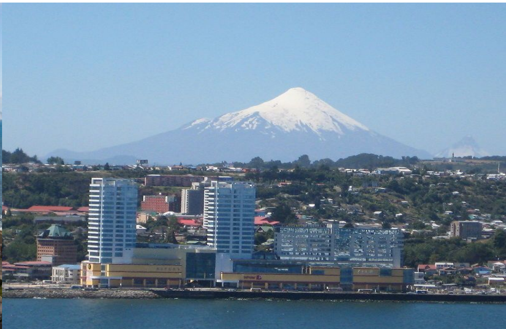
Puerto Montt, Chile